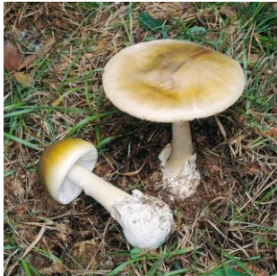
a) buretele viperei ( Amanita phalloides )

21. Ciuperca responsabilă de majoritatea intoxicațiilor mortale este: