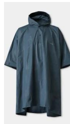
c) pelerina de ploaie

27. Partea colorată/marcată a acului busolei indică: