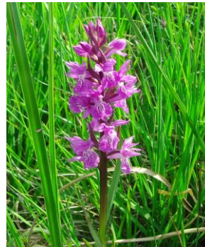
c) poroinic ( Orchis maculata )