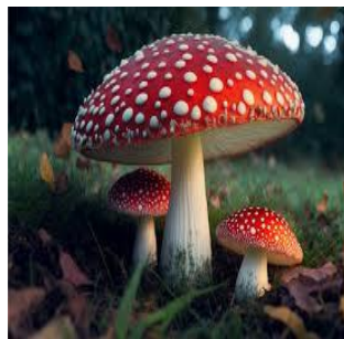
b) buretele muștelor ( Amanita muscaria )