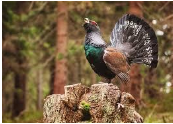
a) cocoșul de munte ( Tetrao urogallus )

20. Animalul cunoscut sub denumirea populară de gotcan (femela: gotcă), care se întâlnește în arealul masivului Călimani, este: