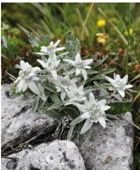
a) floare de colț ( Leontopodium alpinum )

19. În arealul masivului Călimani se pot întâlni următoarele flori, cu excepția: