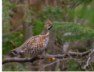
b) ierunca ( Tetrastes bonasia )