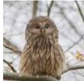
c) huhurezul mare ( Strix uralensis )

23. Refugiul care nu se găsește în masivul Călimani este: