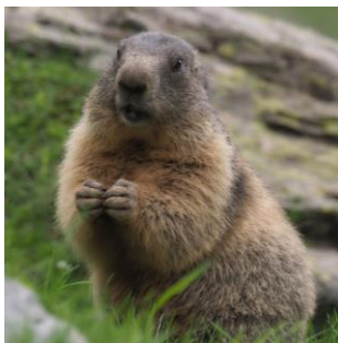
a) marmota alpină ( Marmota marmota )

22. Nu trăiește în arealul masivului Călimani: