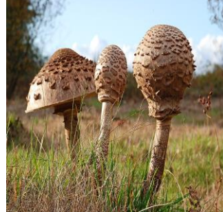
c) buretele șerpesc ( Macrolepiota procera )

22. Nu trăiește în arealul masivului Călimani: