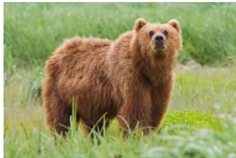
b) ursul brun ( Ursus arctos )