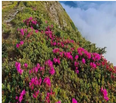
b) rododendron ( Rhododendron myrtifolium )